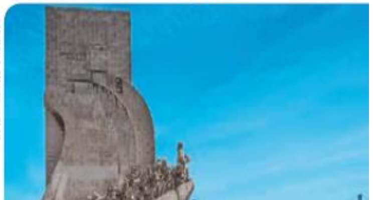
Figura 2. Monumento aos Descobrimentos, em Lisboa, capital de Portugal (2014), às margens do Rio Tejo. Inaugurado em 1960, esse monumento tem a forma de uma caravela e homenageia, entre outros, os navegadores, cartógrafos e intelectuais que participaram das Grandes Navegações marítimas dos séculos XV e XVI. Atualmente, é um importante ponto de atração turística.

Entre o século XV e meados do XIX, ampliaram-se a migração de pessoas e a circulação de produtos, fazendo surgir novos mercados entre regiões antes isoladas, favorecendo a expansão comercial.