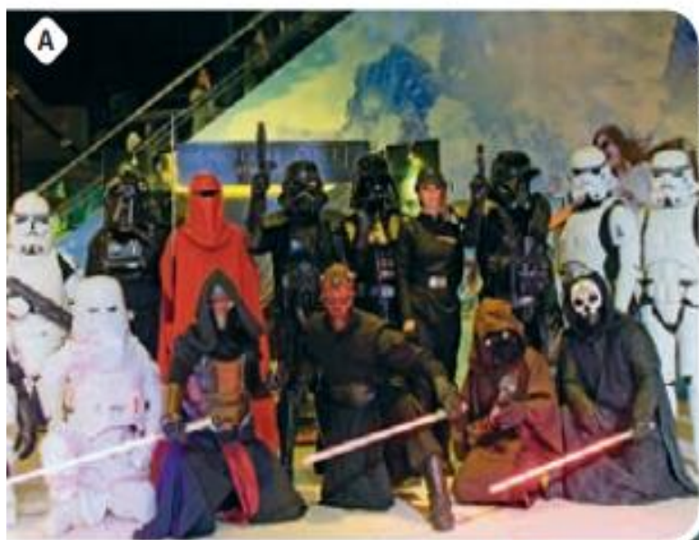
Figura 1. Com o avanço das tecnologias de comunicação, pessoas de diferentes culturas e países distantes podem compartilhar informações e hábitos de consumo instantaneamente. Na foto A, jovens na Tailândia

A globalização, porém, não é algo recente. Está em curso há mais de cinco séculos. O que hoje chamamos de globalização é apenas uma etapa específica e avançada de um processo antigo ou do capitalismo.